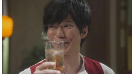
⑧「今夜はパッツと行きましょう！」