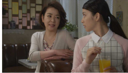
⑨「ヒーローだからって不規則な生活してない？」