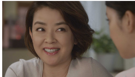
⑩「女性の人生、健康第一よ。」