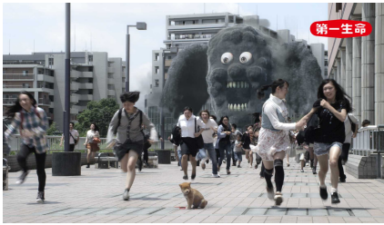
①ワラーから逃げる人々