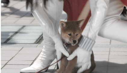
②仔犬を助けたのは