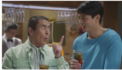
⑦「今回は手強かったですね～」