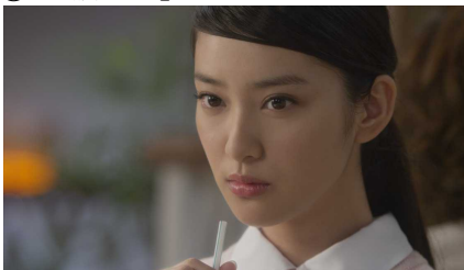
⑥レディは一人考え事をしている