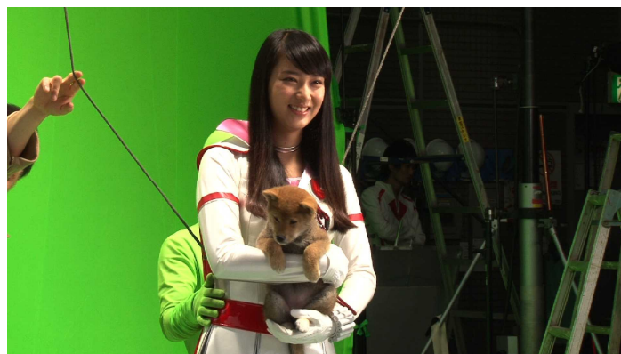
【写真】(左)第一生命 新 TV-CM「D セイバー レディの生き方」篇より (右)CM 撮影風景より