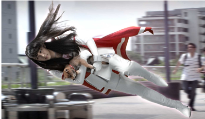
③セイバー・レディ